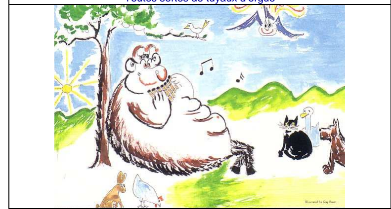
Le vilain dieu Pan, qui aimait à effrayer les gens et les animaux, se trouve un nouveau passe-temps en les charmant avec sa flûte. Cocoricorgue assiste depuis les airs.