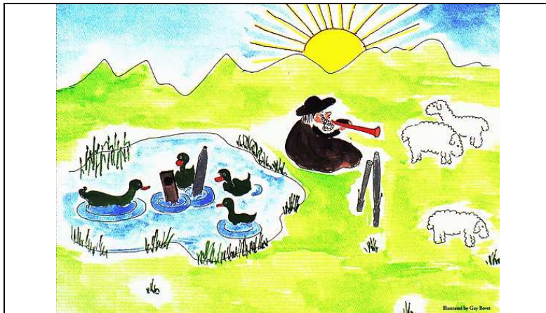
Les tuyaux à anches gardent les moutons avec les bergers et font la trempette avec les canards