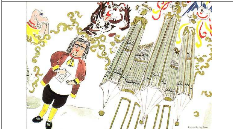
Cocoricorgue a réussi à rassembler tous les tuyaux dans une belle maison et il a invité M. Bach, qui a écrit un morceau exprès pour l'inauguration. Le vilain dieu Pan fait des grimaces à M. Bach, ce qui scandalise beaucoup le brave Ktésibios.